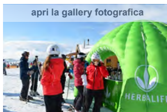
apri la gallery fotografica

Ciaspolate, lezioni di sci, gite in fat-bike e prove prodotto: torna lo sport e il divertimento sulla neve con l'Herbalife Active Winter Tour.