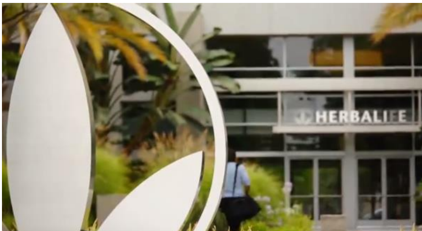
Perhubungan Pelabur ).

Pengurusan percaya ia adalah demi kepentingan terbaik para pemegang saham dan komuniti pelaburan yang lebih besar bahawa mana-mana komunikasi luar dibuat melalui satu saluran. Apa-apa komen atau kenyataan yang boleh menjadi pengetahuan umum perlu dikaji semula dan diluluskan terlebih dahulu oleh peguam dan profesional kami dalam Hubungan Pelabur dan Komunikasi ( Sila lihat Polisi 7.62 Penganalisis dan Komunikasi